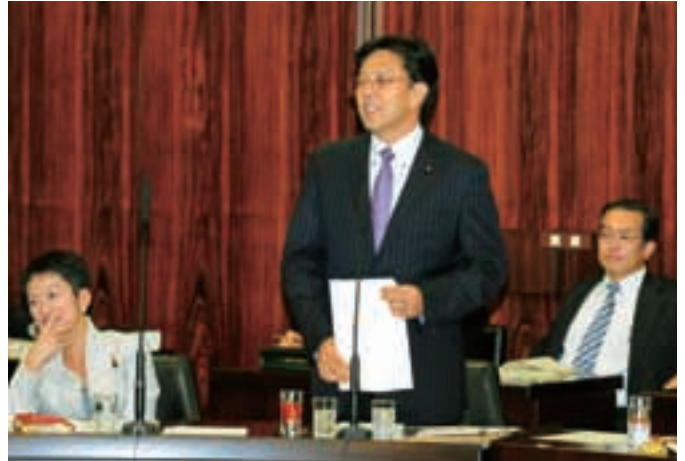
国学力・学習調査の全国一斉から抽出方法への変更、教員免許制度の抜本改正の議論を進め、2011年の通常国会で成案を出すことを提示しました。